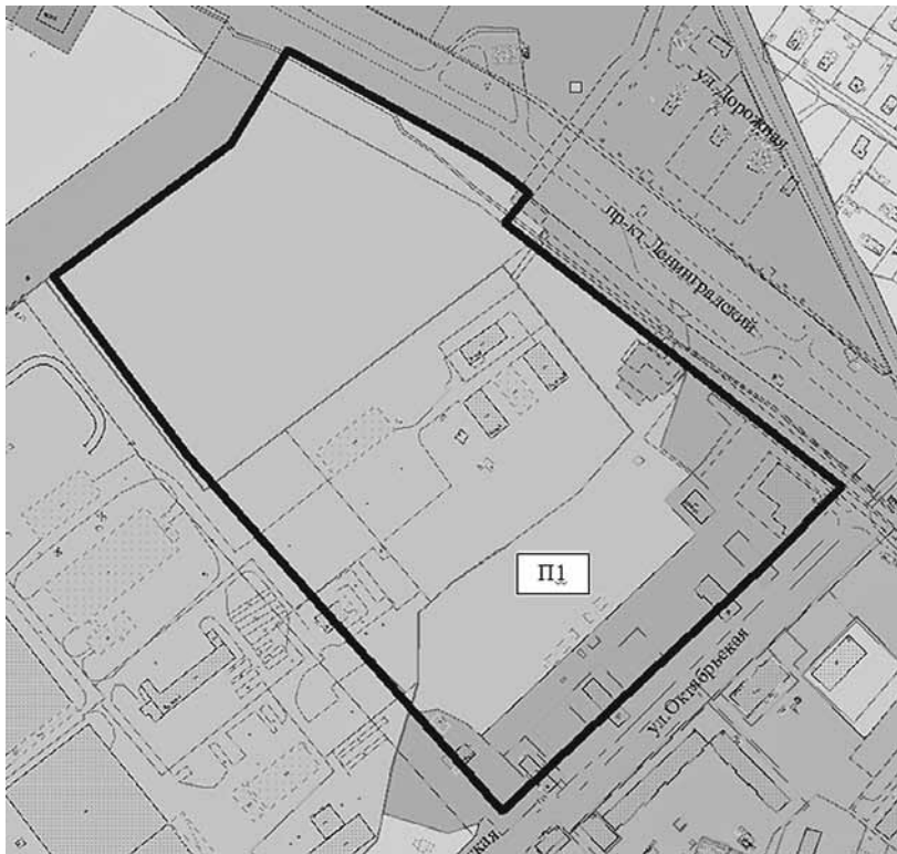
СХЕМА границ проектирования

ПРИЛОЖЕНИЕ № 2 к заданию на подготовку проекта внесения изменений в проект планировки Жаровихинского района муниципального образования "Город Архангельск" в границах элемента планировочной структуры: просп. Ленинградский и ул. Октябрьская площадью 12,3751 га