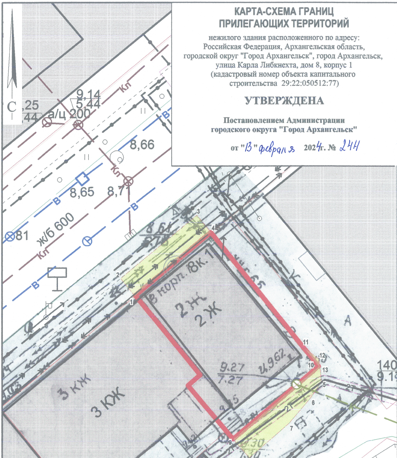
Система координат МСК-29